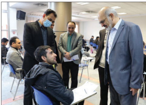
رئیس سازمان سنجش آموزش کشور خبر داد

آزمون‌های دکتری و کارشناسی ارشد سال ۱۴۰۲ در صحت و سلامت کامل برگزار شد